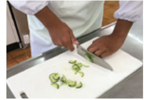
食物調理技術 検定3級