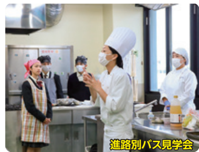
進路別バス見学会