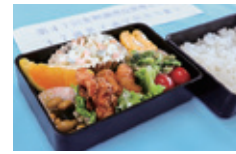
準1級日常食(おべんとう)

食に関する専門的な知識や技術の向上を図り、一人ひとりが健康で豊かな生活が送れるよう食生活を総合的にデザインする能力を身につけます。プロの調理師による実習や講義を実施し、食物調理技術検定の取得を目指します。