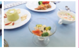
1級供応食(フルコース)