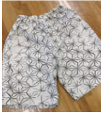
2級ショートパンツ

個人のレベルに合わせて作品を製作し、被服技術を習得します。被服製作技術検定に挑戦します。