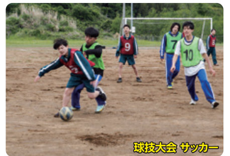
球技大会 サッカー