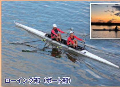
ローイング部 (ボート部)