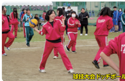
球技大会 ドッチボール